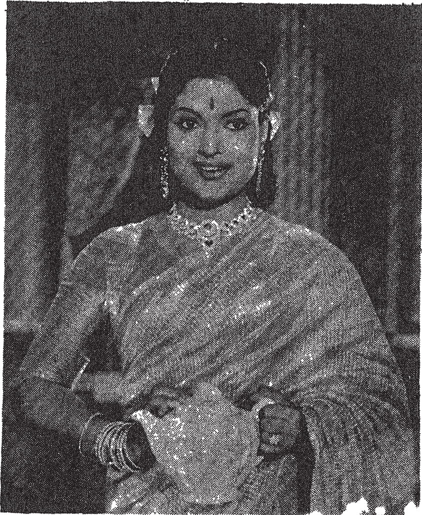
శ్రీరామా పిక్చర్లు "దేశ ద్రోహులు" లో దేవిక

ఒకరోజు మాకు మాడో ఇంటానిద వచ్చి మా అమ్మగారితో మాట్లాడుతూండగా మా ఆస్తుల విషయం వచ్చి, ఆ కోర్కె కచేరీం విషయం ఇంతదాకా తేలలేదు, ఏం జేస్తామండి, ఏదో ప్రాప్తమంటే దక్కుతుంది లేకపోతే పోసి లెండి అని అమ్మ నిస్సహాయతే, అదేమండి అలా అని సొమ్ము పోగొట్టుకుంటామా అని మా అమ్మ గారిని మందలించి ఆవిడ నలహా ఇచ్చింది. ఏమిటంటే, ఎక్కడో ఒకరిమీద పూసకం వస్తుందని అప్పుడు వాళ్లు చెప్పినవన్నీ నిజంగా జరుగుతున్నాయనీ, పైగా మన కష్టాలు తీరడానికి ఆ అమ్మ