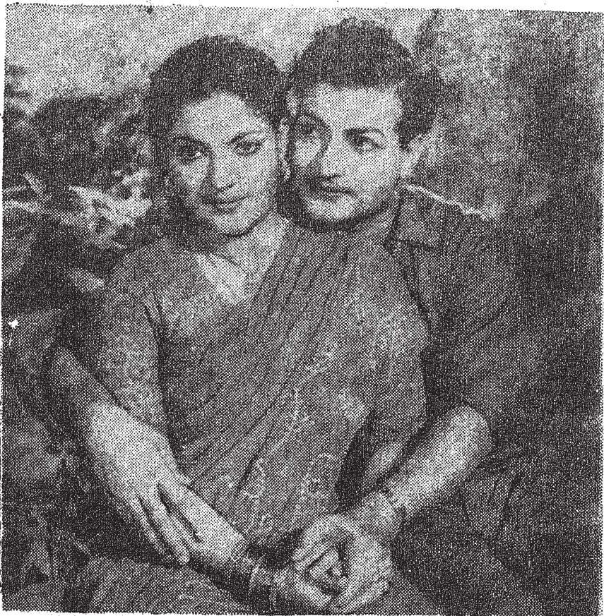
శ్రీరామకృష్ణ ప్రొడక్షన్స్ చిత్రంలో దేవిక, ఎన్.టి. రామారావు ఎం.ఎం. పిక్చర్లు చిత్రంలో రమణమూర్తి, జమున