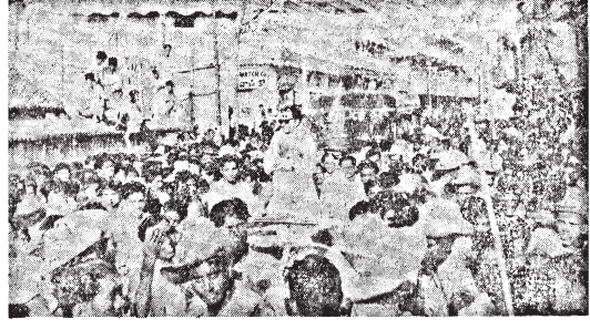
1957 లో విజయవాడ హిందూ సన్మానించు పూరేంపు దృశ్యం